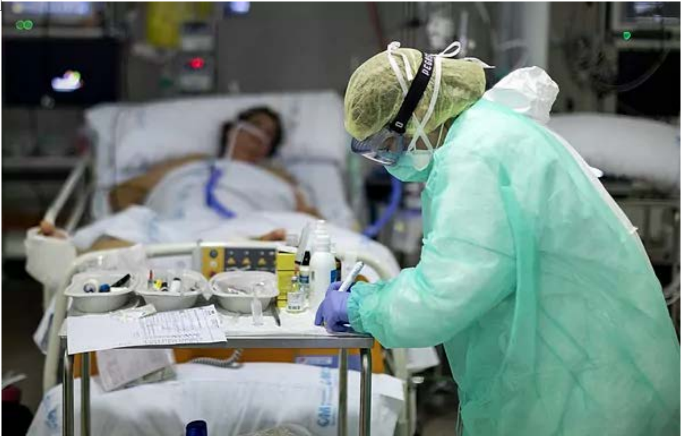
Una enfermera atiende a una persona en una UCI durante uno de los picos de la pandemia.

Existe un descontento general (70%) por la actuación del Gobierno regional o central para facilitar material para evitar los contagios. El muestreo aflora que un 50% manifiesta que su calidad de vida ha empeorado desde febrero de 2020